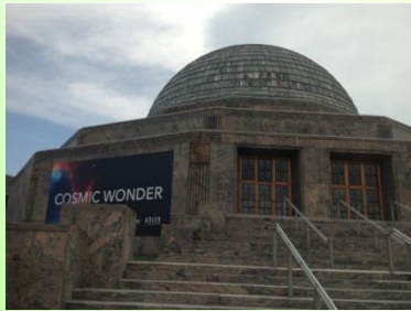
アドラープラネタリウム&天文学博物館