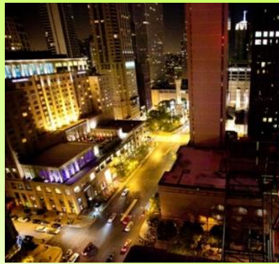
マグニフィセントマイル