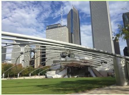
ミレニウム パーク